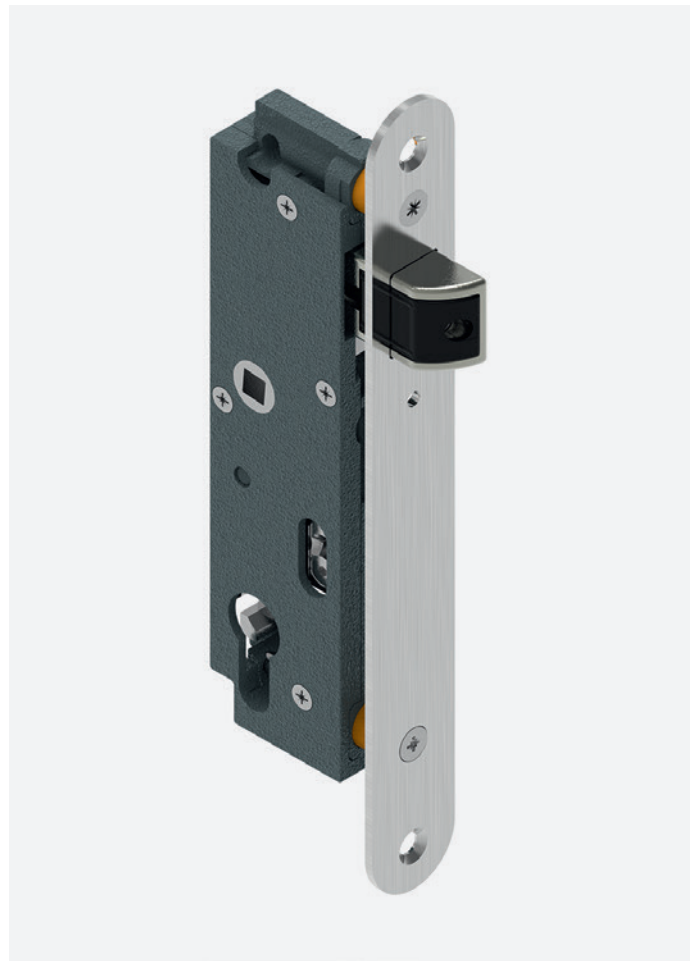
Aperçu du produit.